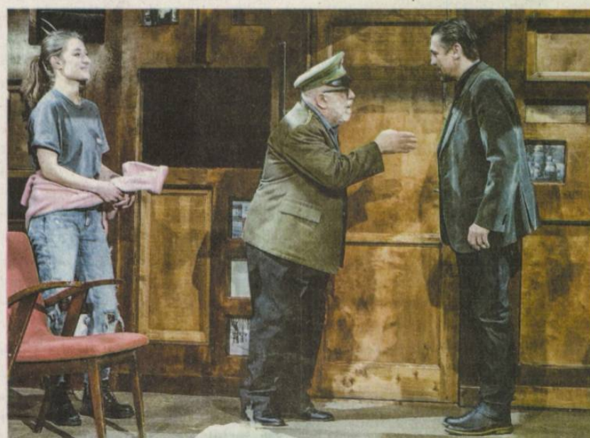
A gyerekek nem bűnrészesek